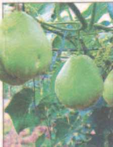
VENTAS CDA-Fintrac introdujo al país la nueva variedad de pataste.

Después de la temporada de exportación, el quintal de pepino se cotizó en San Pedro Sula a 200 lempiras y en la actualidad se vende a 120. La libra se compra entre 6 y 7 lempiras en los mercados Dandy, Medina y El Rápido.