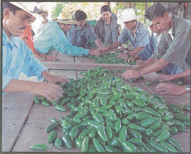
RUBRO El producto es seleccionado y enviado a la compañía Chesnut Wills Funm, luego es llevado a EUA.