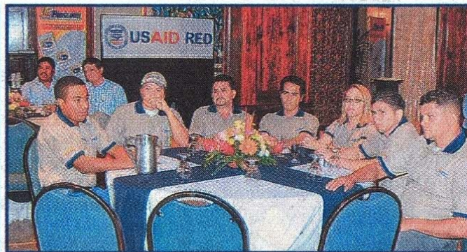
Los supervisores, jefe de planta y la jefatura de personal de PROGCARNE asistieron al importante evento.