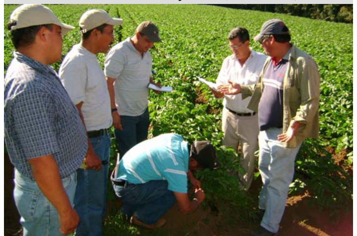
Capacitación Paquete Tecnológico USAID-RED/Caritas, Honduras