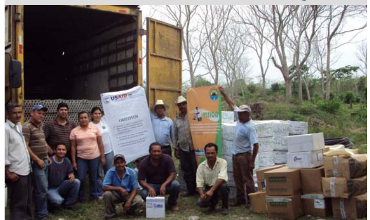
Donación riego por goteo, La Entrada, Copán