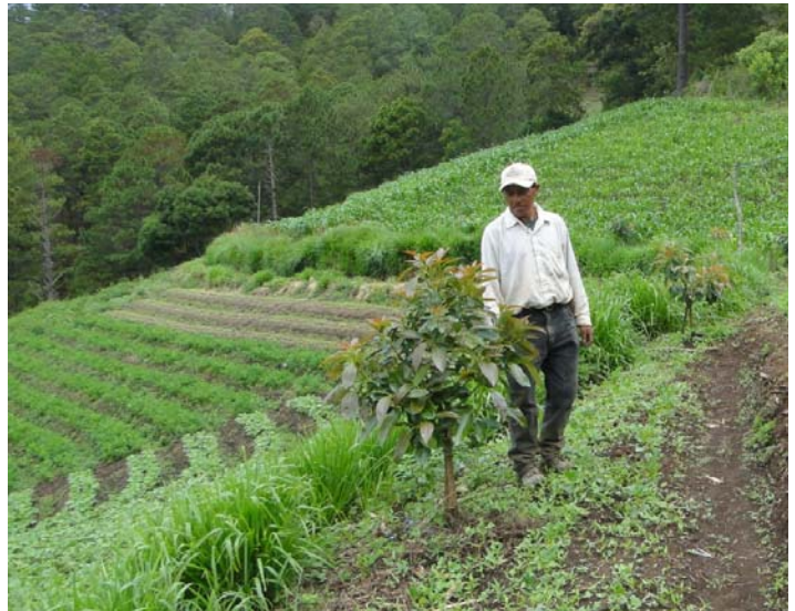
Frijol en asocio con aguacate, Agroforestería La Esperanza, Intibucá