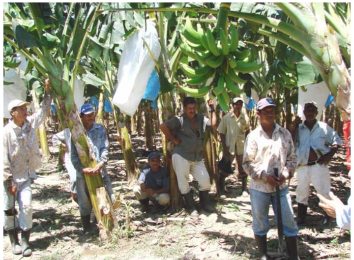
Visita USAID Socios Trabajadores, Olanchito, Yoro

CARITAS: Se han instalado 5 manzanas de riego por goteo donados para 15 productores en tres unidades técnicas de la alianza. Se visitaron unidades técnicas nuevas como: Orocuina, Sta María, Alubaren y Texiguat. Además se brindaron asesorías en actividades como manejo de plántulas en vivero, se hicieron pruebas de plástico o cobertura de cama y uso de manta térmica; además de asesorías en actividades como el uso