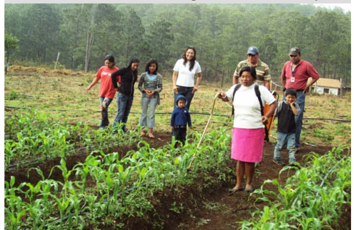
Maíz alta densidad, Visión Mundial Yamaranguila