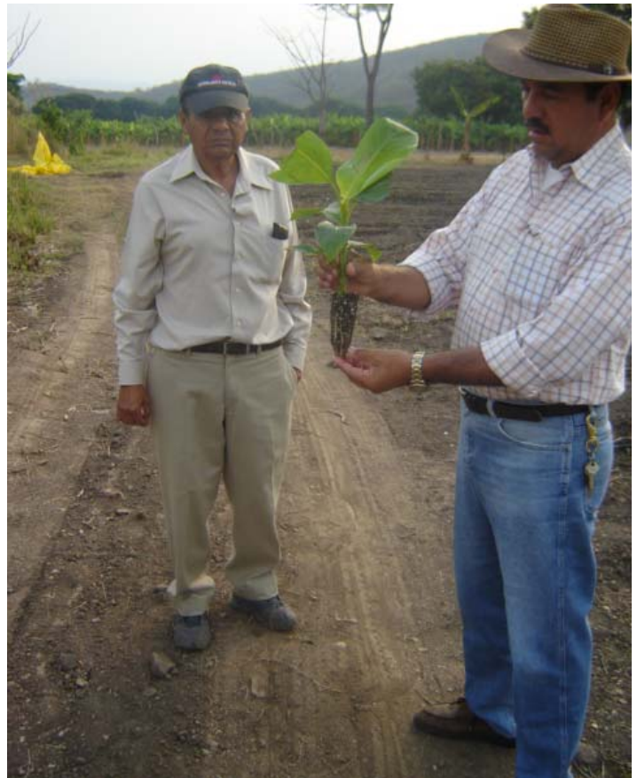
Cantarranas, Francisco Morazán, Transplante de Meristemo de Plátano

Otros: Se realizaron visitas a agroexportadores, y se hicieron reuniones para el inicio de nuevas operaciones de procesamiento de frijol, yuca, malanga y plátano en