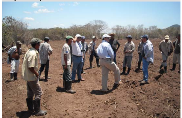
Visita USAID, Olanchito, Yoro