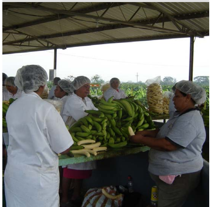
Pelado de plátano, Olanchito, Yoro