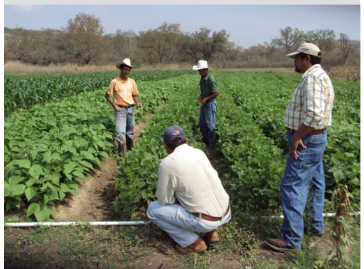
Frijol y Maíz- Visión Mundial Gracias, Lempira