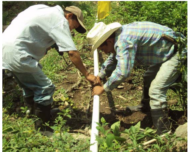
Instalación de sistema de riego, FUNLESOL Lempira