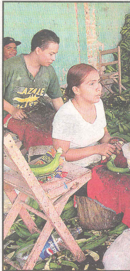
▶ PRODUCCIÓN Personal contratado por la Cooperativa para el envío a los Estados Unidos.

El proyecto es ejecutado con el aporte de la institución Care, el INA y ex empleados de la Tela Railroad Company, que luego del huracán Mitch quedaron desempleados.◀