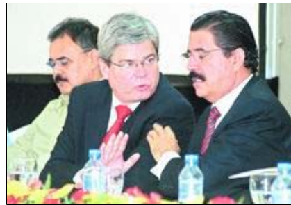
FUNCIONARIOS. El presidente Manuel Zelaya y el embajador Charles Ford conversan en el marco del evento.

Comayagua. Unos 900 pequeños productores locales, diseminados en 15 departamentos del país, han comenzado a exportar y a comercializar sus productos en el mercado local gracias a la asistencia brindada por el programa Cuenta del Desafío del Milenio, auspiciada por el gobierno de Estados Unidos.