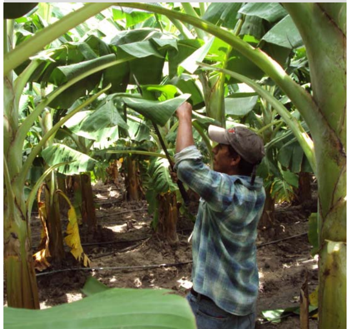
Comayagua, Cirugía en Plátano