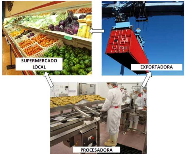
Enlace Tripartito Procesadora, Supermercado Local y Exportadora

El año 2010 comenzó con muchas esperanzas y expectativas en el sector comercial de Honduras. Después de atravesar un 2009 difícil, el comercio vuelve a tomar vida y se buscan nuevas oportunidades de negocio. El componente de valor agregado de USAID - RED no fue la excepción a este comportamiento y aprovechó oportunamente su visión empresarial. Este componente del proyecto brinda asistencia técnica a decenas de empresas agroindustriales, de las cuales hay tres que en este mes han decidido escribir una nueva página en la historia de sus empresas. Estas tres empresas se dedican a rubros