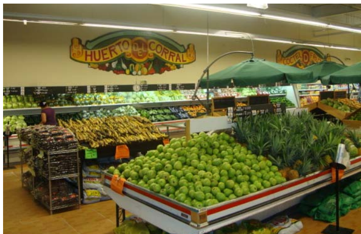
Supermercado Local, Comayagua, Siguatepeque

Este mes, un productor de Orica, Francisco Morazán, cosechó 3 manzanas de tomate con un rendimiento de 3,000 gavetas por manzana, las que vendió a un promedio de US$ 26.00 cada una. Esto representa una venta neta de US$ 234,000. Dadas las condiciones adversas de clima, plagas y enfermedades que han imperado en la zona en los últimos meses, esta producción es sobresaliente. En esta zona hay muchos productores que no han llegado a cosechar debido a las altas incidencias de virosis. Este productor implementó las prácticas básicas para manejar sus cultivos. Utilizó las barreras vivas, las trampas amarillas, plástico mulch sobre sus camas de siembra y además cubrió sus cultivo con manta térmica durante los primeros 25 días. Todas estas prácticas le sirvieron para llegar a tener estos rendimientos en época difícil de producción y las mismas se las ha dictado el proyecto USAID – RED, por lo que él no vacila en