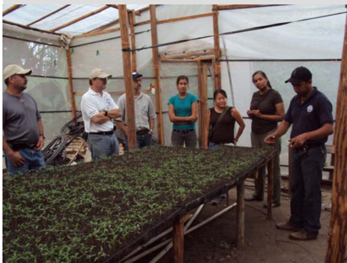
Villaverde, Lempira, visita personal de medio ambiente de USAID