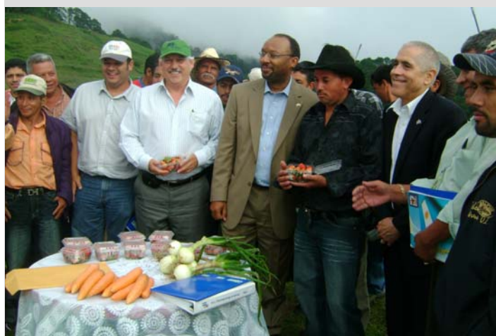
Jutiapa, Francisco Morazán, visita Sub-Secretario de Agricultura, USDA