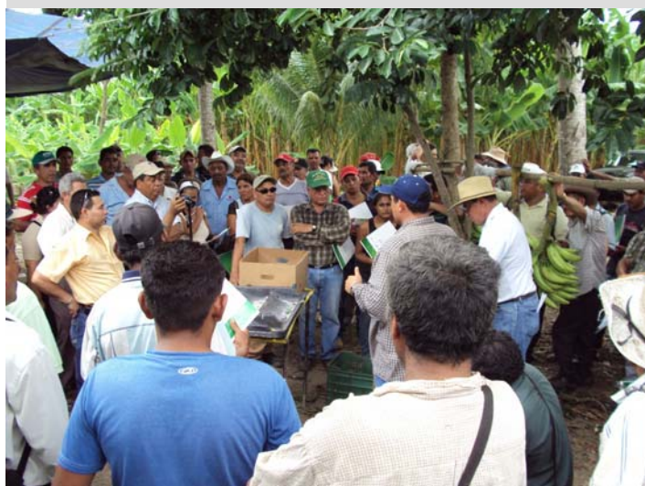
Choloma, Cortés, Día de Campo Plátano, charla Pos cosecha