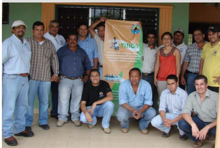
La Entrada, Copán, reunión USAID – RED/ OCDIH